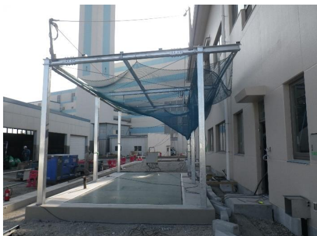
⑨トラックスケール鉄骨建込