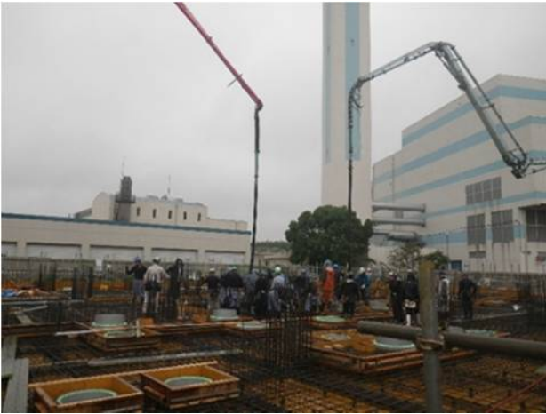
⑦コンクリート打設（1階梁・スラブ）（1）