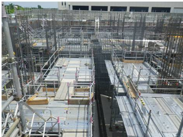
①配筋、型枠組立（地下1階）(1)