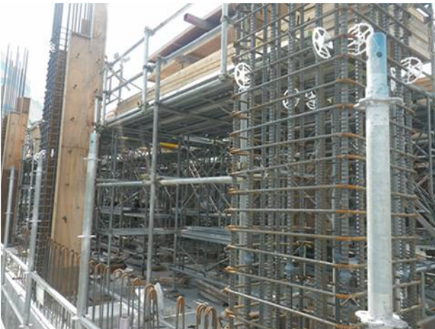
⑨配筋、型枠組立（1階柱・壁）（1）