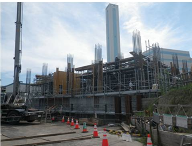
⑪配筋、型枠組立（1階柱・壁）（3）