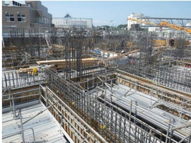
②配筋、型枠組立（地下1階）(2)