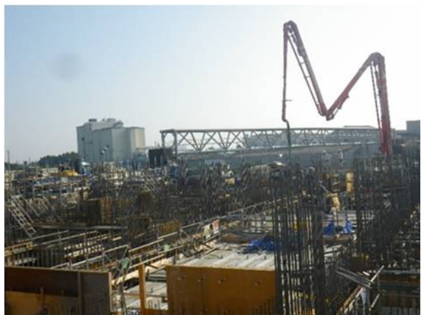
③コンクリート打設（地下1階柱・壁）(1)