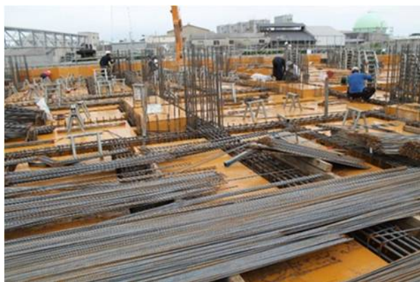
⑤配筋、型枠組立（1階梁・スラブ）(1)